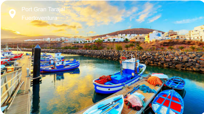
Port Gran Tarajal Fuerteventura

Fuerteventura er først og fremmest kendt for sine ca. 150 gyldne sandstrande. De står i stærk kontrast til det spektakulære, vulkanske landskab, som flere steder ligger lige bag strandene og enkelte steder har farvet sandet sort. En dagsrundtur på øen kan bringe dig til små fiskerlandsbyer og fantastiske udsigtspunkter, fyrtårne og vindmøller samt den charmerende Nuestra Señora de Regla kirke fra 1700-tallet, som er en af øernes arkitektoniske perler med en facade, der er inspireret af Aztekernes traditionelle udsmykninger. Du kan også besøge en aloe vera plantage, en gedefarm samt et saltmuseum, der beskriver og viser, hvordan salt udvindes af havvandet. Det er også oplagt at udforske øen i jeep eller på en buggy, eller hvorfor ikke tage med en glasbundsbaad til den lille ø Lobos? Selvom Lobos' landskab primært består af ørken og vulkaner, er her et rigt dyre- og planteliv, hvorfor øen er et naturbeskyttet område. Gå ikke glip af muligheden for at kigge ned i et krater!