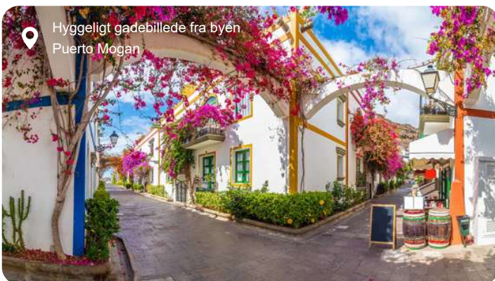
Hyggeligt gadebillede fra byen Puerto Mogan

Igennem flere årtier har Gran Canaria været blandt danskernes foretrukne rejsemål i vinterhalvåret med sit behagelige klima og sine skønne sandstrande. De høje sanddyner i Maspalomas på øens sydside leder tankerne hen på Sahara, men bestiger du en af dynerne, har du her udsigten til det blå Atlanterhav. Las Palmas er en ganske stor by, hvor du godt kan miste overblikket, men fra Santa Ana katedralens sydlige tårn har du en eminent udsigt over hele byen, hvor der er rigtig gode muligheder for at shoppe. Bare 20 km herfra finder du Gran Canarias ældste og - ifølge mange - smukkeste by: Teror. Den er beliggende i en malerisk dal mellem grønne bjergkamme og fortryller med smukke, historiske huse i alle regnbuens farver. En anden besøgs værdig by er charmerende Puerto de Mogan, der også kaldes Lille Venedig grundet de pittoreske broer og vandindløb, der blander sig med husene i typisk Middelhavsstil.