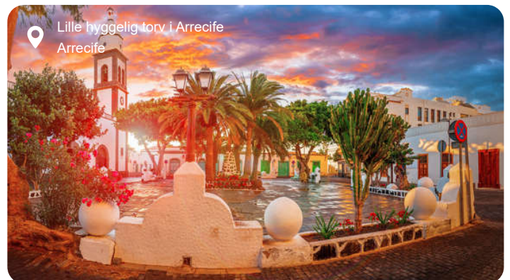
Lille hyggelig torv i Arrecife Arrecife

Den lille havneby Arrecife fungerer som Lanzarotes hovedstad. Via en intakt vindebro kan du besøge byens borg, som i sin tid blev bygget for at dæmme op for piratangreb. Flere gamle villaer i klassisk kanarisk arkitektur og en yndig kirke kan også beskues i byen, men ellers lokkes de fleste på udflugt rundt på øen. Nationalparken Timanfaya dækker en fjerdedel af Lanzarote med sine spektakulære landskaber skabt af tidligere tiders vulkanudbrud. Du kan køre rundt i jeep blandt vulkanerne og se nærmere på et netværk af underjordiske grotter, og skal det være mere frodigt, er en vandretur i De 1000 Palmers Dal en mulighed.