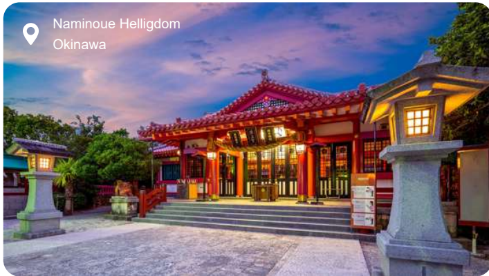
Naminoue Helligdom Okinawa

Okinawa er Japans tropiske øgruppe, hvor havet glitrer i nuancer af turkis og blå, og palmeklædte strande danner kontrast til den krigshistorie og særprægede kultur, som præger øen. Her lægges der til i hovedbyen Naha - en moderne, men charmerende storby med skyskrabere, monorail og mindesmærker, der vidner om øens dramatiske fortid. Under Anden Verdenskrig blev byen næsten jævnet med jorden under det blodige slag om Okinawa, hvor titusindvis af civile mistede livet. Du kan stadig gå gennem de smalle tunneler under jorden, hvor den japanske hærs hovedkvarter lå, og se de spartanske rum præcis som de blev forladt. Historien stopper dog ikke her. Okinawa var tidligere hjem for det selvstændige Ryukyu-rige, og øens kulturelle særpræg lever videre i maden, musikken og arkitekturen. Hele ni steder på UNESCO's verdensarvsliste fortæller om denne arv, heriblandt det rødglødende Shuri-slot, det fredfyldte Tamaudun-mausoleum og Shikinaen-haven med sine buede tage og lotusdamme. Du kan også tage uden for byen og opleve koralrev, havskildpadder og landsbyer, hvor der stadig spilles på det traditionelle strengeinstrument, shamisen, og kvinder væver i hånden. Okinawa føles som Japan i en blødere udgave - med egen identitet, et varmt hai sai i stedet for det formelle konnichiwa , og en historie, der går dybt under huden.