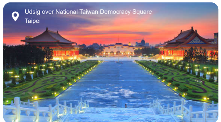
Udsigt over National Taiwan Democracy Square Taipei

Mørkegrønne bjergskrånninger omfavner havnen i Keelung, hvor skyskrabere, templer og fiskehaller spejler sig i det skiftende lys over havet. Ved havnefronten blander duften af saltvand og frisk fisk sig med røgelse fra det smukke Dianji-tempel, hvis røde søjler og gulddetaljer danner en fredfyldt kontrast til det livlige bybillede. En udflugt til det særprægede Yehliu Geopark vest for byen fører dig til et landskab, hvor vind og hav har skabt klippeformationer, der ligner skulpturer – heriblandt den berømte "Queen's Head". Ikke langt fra Keelung ligger Taipei, som nås på under en time med tog og åbner døren til Taiwans moderne puls og kulturelle dybde. Her kan du besøge det storslåede National Palace Museum, der rummer en af verdens fineste samlinger af kinesisk kunst, eller tage elevatoren op i Taipei 101 og skue ud over storbyen fra det ikoniske tårns 89. etage. Chiang Kai-shek Memorial Hall og Longshan-templet vidner om øens dramatiske historie og spirituelle rødder, mens grønne oaser som Elephant Mountain og Da'an Park inviterer til ro og udsigt. Keelung fungerer som et stemningsfuldt udgangspunkt, hvorfra både kystens naturkræfter og hovedstadens kulturskatte kan opleves.