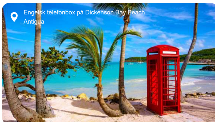
Engelsk telefonbox på Dickenson Bay Beach Antigua

Farverige træhuse med udskaarne verandaer, afskallede facader og bliktag i rødt og turkis sætter kulør på St. John's, Antiguas lille, livlige hovedby. Byens centrum er overskueligt og levende, og her finder du både kolonihistoriske bygninger og små lokale museer, som giver et indblik i øens britiske arv og afrocaribiske kultur. I havnen ligger farverige fiskerbåde side om side med store krydstogtskibe, og fra den lille promenade er der udsigt over Det Caribiske Havs klare blå nuancer. Ikke langt fra byen ligger nogle af Antiguas største seværdigheder: Nelson's Dockyard i English Harbour er en velbevaret flådebase fra 1700-tallet, hvor du kan gå mellem gamle stenhuse og mastekraner og få et glimt af livet under Royal Navy. Området er på UNESCO's verdensarvsliste og oser af maritim historie. Kører du videre op ad bjergvejene, når du til Shirley Heights, der er en tidligere udkigspost med storstået udsigt over bugten og havet. Øen er kendt for sine mange strande - faktisk én for hver dag i året, som man siger - og du finder alt fra stille laguner til strækninger med bølger og liv. Antigua er rig på historie, men det er også en ø, hvor rytmen er afslappet, og naturen altid lige om hjørnet.