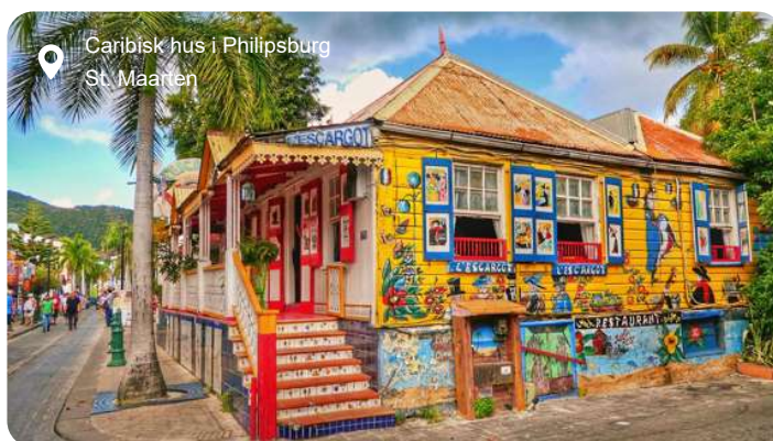
Caribisk hus i Philipsburg St. Maarten

Farvestrålende huse i kolonistil, glitrende butikker og turkisblåt hav danner rammen om Philipsburg, hovedbyen på den hollandske del af St. Maarten. Den kompakte by ligger som en perle mellem to bugter og er let at udforske til fods. Langs strandpromenaden, Boardwalk, venter bløde sandstrande, palmer og caféer, mens Front Street bagved byder på caribisk stemning og toldfri shopping i alt fra smykker til parfume og elektronik. Vil du dykke dybere ned i øens historie, kan du besøge Fort Amsterdam, der blev opført af hollænderne i 1600-tallet og stadig vogter over bugten med kanoner og udsigt. Længere inde i landet lokker de grønklædte bakker og små landsbyer, og på en udflugt kan du opleve både den franske og hollandske del af øen på én dag. Et højdepunkt for mange er et besøg ved Maho Beach, hvor fly fra hele verden lander blot få meter over hovedet på badegæster - en oplevelse, der er lige dele adrenalinus og turistmagi. Øen rummer også rolige laguner, kreolske fiskeretter og små kunstgallerier, og trods sin beskedne størrelse føles St. Maarten som en hel lille verden - med kontraster, charme og caribisk lethed.