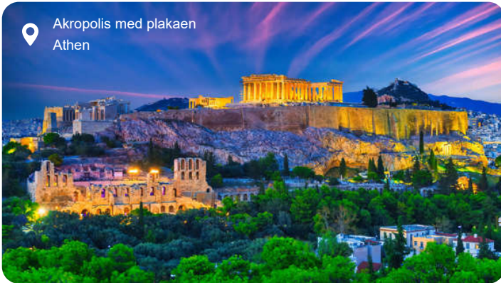
Akropolis med plakaen Athen

Krydstogtshavnen hedder Piraeus. Herfra er der ca. 12 km til centrum af Athen. I den græske hovedstad kan du gå på opdagelse i Demokratiets vugge, der gemmer på 5.000 års fortællinger om krige, menneskelig udvikling og velstand. Athen er en skøn blanding af gammelt og nyt, og således ligger gamle ruiner og moderne luksushoteller side om side og skaber en komprimeret diversitet, som ikke opleves mange andre steder i verden. Akropolis er selve symbolet på Athen og troner over byen, hvorfra det har overlevet mange forskellige civilisationer, hvis stemmer man næsten kan høre mellem de imponerende doriske søjler. Lige nedenfor Akropolis ligger det charmerende Plaka-distrikt, hvis smalle stenbelagte stræder gemmer på hyggelige restauranter og beværtninger samt finurlige butikker med spændende brugskunst. Athen er også fødestedet for de moderne olympiske lege, som har været afholdt stort set hvert 4. år siden 1896. Det oprindelige atletikstadion står stadig, så du kan løbe en runde eller forsøge med et længdespring eller blot sætte dig på tribunen og overvære andres anstrengelser.