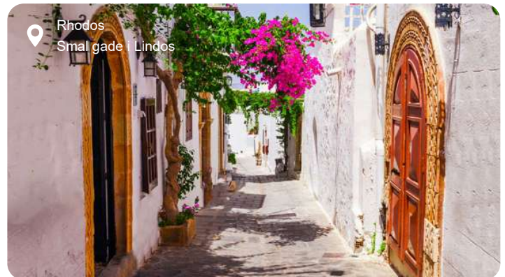
Rhodos Smal gade i Lindos

Rhodos er en ø, hvor myter, middelalder og Middelhav mødes i en solvarm symfoni af lys og sten. Den gamle bydel i Rhodos by er som et levende museum - en labyrint af smalle gyder, brolagte pladser og massive bymure, der blev opført af johanniterridderne i 1300-tallet. Her går du under hvælvede porte og forbi palæer og moskéer, mens lyset reflekteres i kalksten og marmor. Riddergaden fører dig op til Stormesterens Palads, hvor udstillingsrum og mosaikgulve fortæller om en tid, hvor øen var en korsfarerborg i Middelhavets hjerte. Ikke langt derfra ligger den antikke by Kamiros stille og åben mod havet, hvor søjler og cisterner stadig vidner om det klassiske Grækenland. Længere mod syd rejser Lindos sig som en hvidkalket klynge under sin akropolis - en hellig høj med udsigt over bugten og de blågrønne laguner. Rhodos er rig på naturoplevelser: I sommermånederne kan du vandre i Sommerfugledalen, hvor tusindvis af farvede sommerfugle samler sig i skyggen, eller finde ro ved en af øens mange små klippebugter med krystallart vand. Øens lange historie mærkes ikke kun i ruinerne, men også i dagligdagen - specielt i de små bjergbyer, hvor kaffe serveres i metalskåle, og ældre mænd samles under platantræer for at dele historier fra et liv, der synes langsommere end resten af verden.