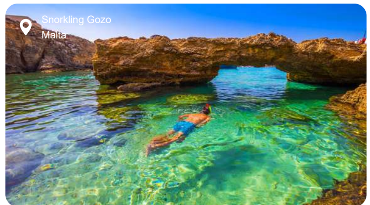
Snorkling Gozo Malta

Malta er en lille øgruppe bestående af 7 øer, hvoraf de 3 – hovedøen Malta samt Gozo og Comino – er beboet. Med sin strategiske beliggenhed mellem Nordafrika og Italien har Malta igennem århundreder været eftertragtet jord, og herredømmet over øerne har skiftet hænder flere gange igennem historien, hvilket har sat sit præg på både sproget, gastronomien og arkitekturen. Maltesisk er således afledt af arabisk blandet med italiensk, mens middelhavskøkkenet blandes med det nordafrikanske. Malteserne er også meget stolte af de legendariske riddere, der forsvarede øen mod tyrkerne og lancerede korstogene. Disse riddere går under mange navne, hvoraf Johanniterordenen og Malteserordenen er de mest kendte. Det var en af ordenens stormestre, der grundlagde Valletta og gjorde byen til hovedstad i midten af 1500-tallet, og mange af byens for øvrigt meget smukke barokke bygninger stammer fra denne tid. På trods af sin beskedne størrelse er Valletta spækket med historisk interessante seværdigheder, hvoraf den imponerende katedral og Stormesterens Palads skal fremhæves sammen med et par museer, der fortæller den spændende historie om ridderne og deres bedrifter. Valletta, der er Europas sydligste og EU's mindste hovedstad, er optaget på UNESCO's Verdensarvsliste, og den er en yderst betagende by at vandre rundt i, da den emmer af historie og romantik.