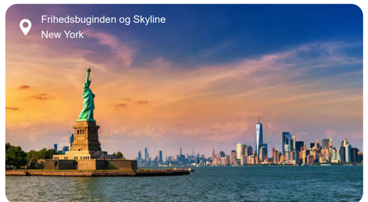
Frihedsbuginden og Skyline New York

New York er indbegrebet af storby, og alene byens skyline er nok til at vække forventning. Men bag skyskrabernes glas og stål gemmer der sig et utal af stemninger og oplevelser, der spænder fra det pulserende til det næsten poetiske. En dag her kan føre dig fra Central Parks grønne åndehul og ud til Hudson River med udsigt til Frihedsgudinden, og videre gennem kvarterer med hver deres karakter – fra de brostensbelagte gader i SoHo til Harlem med sine gospeltoner og Little Italy med duften af friskbagt focaccia. Du kan lade dig forføre af stemningen på en klassisk diner, mærke historiens vingesus ved 9/11 Memorial, tage op i Empire State Building og se byen glitre i alle retninger, eller lade dig opsluge af kunst på MoMA og gallerier i Chelsea. Times Square lyser hele døgnet, mens Brooklyn lokker med street art, vintagebutikker og kreative caféer. Er du til kontraster, kan du stå midt på Wall Street om formiddagen og vandre på den grønne, forhøjede High Line om eftermiddagen. Og selvom tempoet er højt, er der øjeblikke, hvor byen føles næsten intim – som når jazzmusikken flyder ud fra en bar i Greenwich Village, eller når solen farver bygningerne gyldne ved solnedgang.