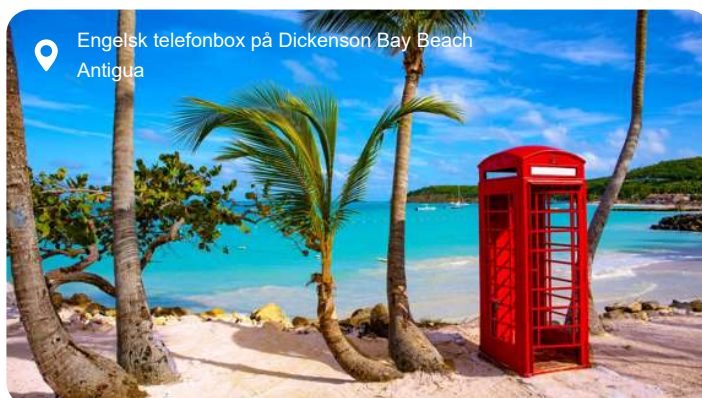
Engelsk telefonbox på Dickenson Bay Beach Antigua

Farverige træhuse med udskaarne verandaer, afskallede facader og bliktag i rødt og turkis sætter kulør på St. John's, Antiguas lille, livlige hovedby. Byens centrum er overskueligt og levende, og her finder du både kolonihistoriske bygninger og små lokale museer, som giver et indblik i øens britiske arv og afrocaribiske kultur. I havnen ligger farverige fiskerbåde side om side med store krydstogtskibe, og fra den lille promenade er der udsigt over Det Caribiske Havs klare blå nuancer. Ikke langt fra byen ligger nogle af Antiguas største seværdigheder: Nelson's Dockyard i English Harbour er en velbevaret flådebase fra 1700-tallet, hvor du kan gå mellem gamle stenhuse og mastekraner og få et glimt af livet under Royal Navy. Området er på UNESCO's verdensarvsliste og oser af maritim historie. Kører du videre op ad bjergvejene, når du til Shirley Heights, der er en tidligere udkigspost med storstået udsigt over bugten og havet. Øen er kendt for sine mange strande - faktisk én for hver dag i året, som man siger - og du finder alt fra stille laguner til strækninger med bølger og liv. Antigua er rig på historie, men det er også en ø, hvor rytmen er afslappet, og naturen altid lige om hjørnet.