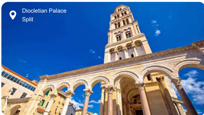
Diocletian Palace Split

Den livlige, kroatisk kulturby Splits fortryllende, gamle bykerne kan spore sine rødder tilbage til Antikken, hvor Split var under romersk herredømme. Her forenes fortid og nutid med romerske paladser på den ene side og moderne arkitektur og butikker på den anden. Omdrejningspunktet i den gamle bydel er den romerske kejser Diocletians palads med 16 tårne og 3 templer fra år 295. Paladset er siden ombygget og tilpasset flere gange af efterkommende herskere og ligger i dag meget tæt på Rivaen – den pulserende og fashionable, palmefyldte gade ved vandet, hvor du finder butikker og caféer og kan beskue det lokale liv. Yndede udflygtsmål fra Split inkluderer de gamle byer Solin og Trogir med mange levn fra Antikken og Krka Nationalpark med smukke vandfald, vandmøller og betagende landskaber.