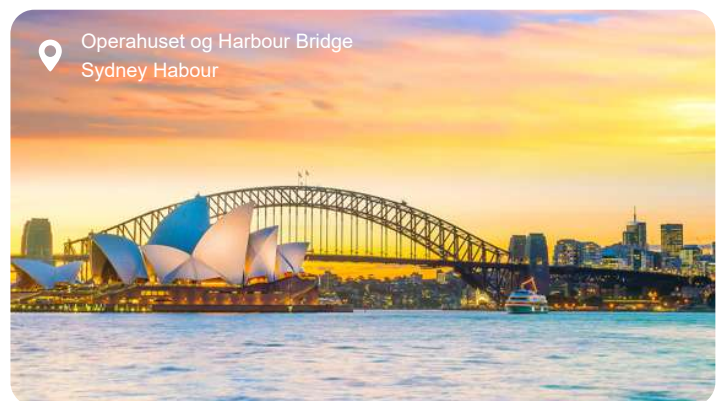
Operahuset og Harbour Bridge Sydney Harbour

I Sydney mødes storbyliv og natur med en lethed, der er helt særlig for Australien. Langs havnefronten strækker byens ikoniske vartegn sig mod himlen – Operahusets hvide sejl og Harbour Bridge i stålgråt spænd – mens færger glider ind og ud mellem bugtens grønklædte vige og småøer. Du kan slentre gennem The Rocks' brostensbelagte gader med kolonihistorie og kunsthåndværk i hvert hjørne eller tage en kort tur ud til Bondi Beach, hvor surfere danser i brændingen, og klippestier lokker med udsigt over det turkisblå hav. En sejltur på havnen afslører Sydneys dramatiske kystlinje fra vandsiden, og med lidt held får du øje på legesyge delfiner eller majestætiske pukkelhvaler på vej nordpå. I den botaniske have breder eukalyptustræerne deres sødlige duft, og kakaduer skrider i kronerne, mens du skuer ud over vandet. Ikke langt herfra folder Blue Mountains sig ud med blå dis, klippeformationer og vandfald i flere niveauer – oplagt for en dagstur væk fra byens summen. Sydney rummer både elegance og vildskab, og det er netop kontrasten mellem opera og ocean, storby og strand, der gør byen så uforglemmelig.