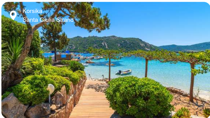
Korsika Santa Giulia Strand