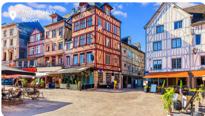
Hyggelig torv Rouen

Le Havre er en moderne og livlig by i Normandiet, hvis bymidte blev genrejst efter Anden Verdenskrig og derfor fremviser en helt særlig moderne arkitektur. Udflugtsmulighederne fra Le Havre er mange og inkluderer typisk ture til den franske hovedstad, Paris, eller landingsstrandene, hvor de amerikanske styrker i sin tid gik i land og var stærkt medvirkende til de allieredes efterfølgende sejr. Normandiets "historiske hovedstad", Rouen, er også en mulighed. Den stemningsfulde, gamle bydel har mere end 700 smukke bindingsværkshuse, et astronomisk ur fra 1500-tallet og den imponerende romersk-katolske katedral, der er Frankrigs højeste kirke. Det var også på byens gamle markedsplads, at Jean d'Arc i sin tid blev brændt på bålet.