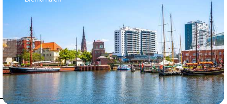
Udsigt over havnen Bremerhafen

Bremerhaven er en by med en rig maritim historie og en moderne tilgang til at udnytte sin havneplacering. Den tilbyder en bred vifte af aktiviteter og attraktioner, der appellerer til både maritime entusiaster og besøgende, der ønsker at udforske byens kulturelle og rekreative muligheder. Bremerhavens "Havenwelten" er et moderne kompleks af rekreative områder, restauranter og attraktioner langs havnen. Byen har en lang historie inden for søfart og skibsbygning. Det er hjemsted for flere maritime museer, hvor besøgende kan udforske Tysklands maritime arv.