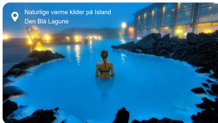
Naturlige varme kilder på Island Den Blå Lagune

Reykjavik er verdens nordligste hovedstad, men den emmer af liv, kunst og geotermisk varme. Her mødes nordisk enkelhed og islandsk særpræg i en charmerende blanding af farverige blikfacader, kreative butikker og små caféer med lokale specialiteter. Midt i byen rejser Hallgrímskirkja sig som et moderne vartegn, inspireret af Islands vulkanske klippestrukturer, og fra tårnets top har du udsigt over byens tage og fjorden bagved. Et stenkast derfra glitrer koncerthuset Harpa med sin glasfacade, og nede ved havnefronten står det stiliserede vikingskib Sólfar og skuer mod horisonten. Byen byder også på stærke historiske oplevelser, fra sagaernes verden på Nationalmuseet til moderne fortællinger om naturens kræfter i videnscentret Perlan. Og når trætheden melder sig, er der ikke langt til Reykjaviks mange geotermiske bade - eller til den Blå Lagune, hvor du kan lade kroppen synke ned i varmt, mineralsk vand midt i et lavaørkenlandskab. Reykjavik er desuden det naturlige udgangspunkt for en række uforglemmelige udflugter. Mest kendt er Golden Circle - en rute, der på én dag tager dig til det historiske Thingvellir, hvor verdens ældste parlament blev grundlagt, og hvor to tektoniske plader mødes, til gejseren Strokkur, der springer med få minutters mellemrum, og det brusende Gullfoss-vandfald i to niveauer. Naturen er aldrig langt væk - og det er netop det, der gør Reykjavik så særlig: En lille hovedstad med stor karakter og hele Islands vilde hjerte som baghave.