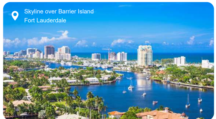
Skyline over Barrier Island Fort Lauderdale

Fort Lauderdale er især kendt for sine lange, palmefyldte strande og det netværk af kanaler, der har givet byen tilnavnet "Amerikas Venedig". Men bag strandstolene og de luksuriøse yachter gemmer der sig en by med mange ansigter. Du kan tage på kanalrundfart med vandtaxa og opleve de eksklusive kvarterer fra vandsiden, hvor elegante villaer og grønne haver spejler sig i det rolige vand. I centrum frister Las Olas Boulevard med sin afslappede stemning, kunstgallerier, caféer og butikker i alle afskygninger, og du kan nemt bruge timer på at udforske gaden til fods. Vil du dykke dybere ned i kulturen, er det værd at besøge det historiske Bonnet House med tropisk have og et glimt af Floridas kunstnerliv i begyndelsen af 1900-tallet. For naturelskere er Everglades kun en kort køretur væk – her kan du suse gennem sumpen i airboat og spotte alligatorer og farvestrålende fugle i det vidtstrakte vådland.