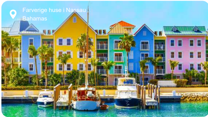
Farverige huse i Nassau Bahamas