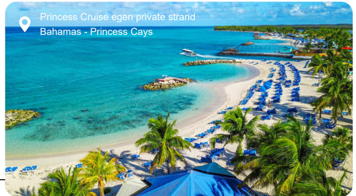
Princess Cruise egen private strand Bahamas - Princess Cays

Princess Cays er en uforglemmelig destination i det smukke Caribiske Hav. Denne private ø i Bahamas er ejet af Princess Cruises og tilbyder besøgende en idyllisk oplevelse med hvide sandstrande, turkisblåt vand og en overflod af spændende aktiviteter. Beliggende på Eleuthera Island i Bahamas, byder Princess Cays på afslapning i solen, vandsport som snorkling og kajakroning, lækker grillmad og farverige lokale markeder. Det perfekte sted at nyde en stranddag med afslapning i solen.