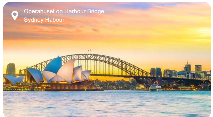
Operahuset og Harbour Bridge Sydney Harbour

I Sydney mødes storbyliv og natur med en lethed, der er helt særlig for Australien. Langs havnefronten strækker byens ikoniske vartegn sig mod himlen – Operahusets hvide sejl og Harbour Bridge i stålgråt spænd – mens færger glider ind og ud mellem bugtens grønklædte vige og småøer. Du kan slentre gennem The Rocks' brostensbelagte gader med kolonihistorie og kunsthåndværk i hvert hjørne eller tage en kort tur ud til Bondi Beach, hvor surfere danser i brændingen, og klippestier lokker med udsigt over det turkisblå hav. En sejltur på havnen afslører Sydneys dramatiske kystlinje fra vandsiden, og med lidt held får du øje på legesyge delfiner eller majestætiske pukkelhvaler på vej nordpå. I den botaniske have breder eukalyptustræerne deres sødlige duft, og kakaduer skrider i kronerne, mens du skuer ud over vandet. Ikke langt herfra folder Blue Mountains sig ud med blå dis, klippeformationer og vandfald i flere niveauer – oplagt for en dagstur væk fra byens summen. Sydney rummer både elegance og vildskab, og det er netop kontrasten mellem opera og ocean, storby og strand, der gør byen så uforglemmelig.