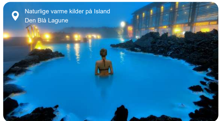
Naturlige varme kilder på Island Den Blå Lagune

Reykjavik er verdens nordligste hovedstad, men den emmer af liv, kunst og geotermisk varme. Her mødes nordisk enkelthed og islandsk særpræg i en charmerende blanding af farverige blikfacader, kreative butikker og små caféer med lokale specialiteter. Midt i byen rejser Hallgrímskirkja sig som et moderne vartegn, inspireret af Islands vulkanske klippestrukturer, og fra tårnets top har du udsigt over byens tage og fjorden bagved. Et stenkast derfra glitrer koncerthuset Harpa med sin glasfacade, og nede ved havnefronten står det stiliserede vikingskib Sólfar og skuer mod horisonten. Byen byder også på stærke historiske oplevelser, fra sagaernes verden på Nationalmuseet til moderne fortællinger om naturens kræfter i videnscentret Perlan. Og når trætheden melder sig, er der ikke langt til Reykjaviks mange geotermiske bade - eller til den Blå Lagune, hvor du kan lade kroppen synke ned i varmt, mineralsk vand midt i et lavaørkenlandskab. Reykjavik er desuden det naturlige udgangspunkt for en række uforglemmelige udflugter. Mest kendt er Golden Circle - en rute, der på én dag tager dig til det historiske Thingvellir, hvor verdens ældste parlament blev grundlagt, og hvor to tektoniske plader mødes, til gejseren Strokkur, der springer med få minutters mellemrum, og det brusende Gullfoss-vandfald i to niveauer. Naturen er aldrig langt væk - og det er netop det, der gør Reykjavik så særlig: En lille hovedstad med stor karakter og hele Islands vilde hjerte som baghave.