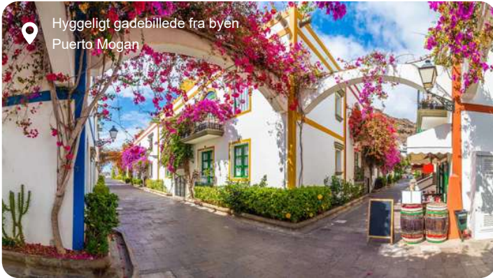
Hyggeligt gadebillede fra byen Puerto Mogan

Igennem flere årtier har Gran Canaria været blandt danskernes foretrukne rejsemål i vinterhalvåret med sit behagelige klima og sine skønne sandstrande. De høje sanddyner i Maspalomas på øens sydside leder tankerne hen på Sahara, men bestiger du en af dynerne, har du her udsigten til det blå Atlanterhav. Las Palmas er en ganske stor by, hvor du godt kan miste overblikket, men fra Santa Ana katedralens sydlige tårn har du en eminent udsigt over hele byen, hvor der er rigtig gode muligheder for at shoppe. Bare 20 km herfra finder du Gran Canarias ældste og - ifølge mange - smukkeste by: Teror. Den er beliggende i en malerisk dal mellem grønne bjergkamme og fortryller med smukke, historiske huse i alle regnbuens farver. En anden besøgs værdig by er charmerende Puerto de Mogan, der også kaldes Lille Venedig grundet de pittoreske broer og vandindløb, der blander sig med husene i typisk Middelhavsstil.