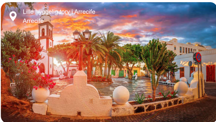
Lille hyggelig torv i Arrecife Arrecife

Den lille havneby Arrecife fungerer som Lanzarotes hovedstad. Via en intakt vindebro kan du besøge byens borg, som i sin tid blev bygget for at dæmme op for piratangreb. Flere gamle villaer i klassisk kanarisk arkitektur og en yndig kirke kan også beskues i byen, men ellers lokkes de fleste på udflugt rundt på øen. Nationalparken Timanfaya dækker en fjerdedel af Lanzarote med sine spektakulære landskaber skabt af tidligere tiders vulkanudbrud. Du kan køre rundt i jeep blandt vulkanerne og se nærmere på et netværk af underjordiske grotter, og skal det være mere frodigt, er en vandretur i De 1000 Palmers Dal en mulighed.