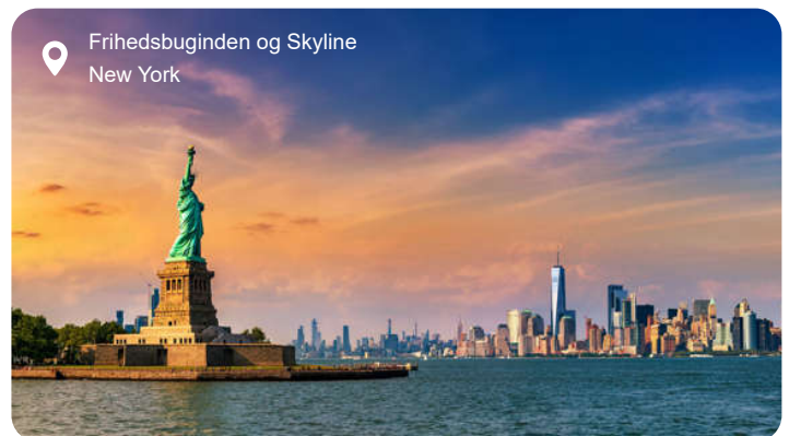
Frihedsgudinden og Skyline New York

New York er indbegrebet af storby, og alene byens skyline er nok til at vække forventning. Men bag skyskrabernes glas og stål gemmer der sig et utal af stemninger og oplevelser, der spænder fra det pulserende til det næsten poetiske. En dag her kan føre dig fra Central Parks grønne åndehul og ud til Hudson River med udsigt til Frihedsgudinden, og videre gennem kvarterer med hver deres karakter – fra de brostensbelagte gader i SoHo til Harlem med sine gospeltone og Little Italy med duften af friskbagt focaccia. Du kan lade dig forføre af stemningen på en klassisk diner, mærke historiens vingesus ved 9/11 Memorial, tage op i Empire State Building og se byen glitre i alle retninger, eller lade dig opsluge af kunst på MoMA og gallerier i Chelsea. Times Square lyser hele døgnet, mens Brooklyn lokker med street art, vintagebutikker og kreative caféer. Er du til kontraster, kan du stå midt på Wall Street om formiddagen og vandre på den grønne, forhøjede High Line om eftermiddagen. Og selvom tempoet er højt, er der øjeblikke, hvor byen føles næsten intim – som når jazzmusikken flyder ud fra en bar i Greenwich Village, eller når solen farver bygningerne gyldne ved solnedgang.