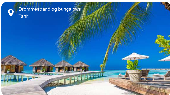
Drømmestrand og bungalows Tahiti