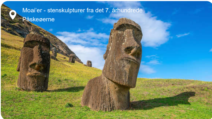
Moai'er - stensculpturer fra det 7. århundrede Påskeøerne

Påskeøerne emmer af mystik og storslåethed - som et afsides hjørne af verden, hvor tiden føles bremset, og naturens kræfter er allestedsnærværende. De ikoniske moai-figurer står som tavse væsner spredt ud over grønne bakker og lavaklipper med blikket vendt mod indlandet, som om de våger over øens hemmeligheder. Landskabet veksler mellem sorte vulkanske klipper, saftigt græs og kratersøer, hvor siv svajer i vinden. Du kan vandre op til Rano Raraku – den udslukte vulkan, hvor moai'erne blev hugget direkte ud af fjeldet – og se halvferdige skulpturer, der stadig ligger, som om stenhuggerne lige har forladt stedet. I kystbyen Hanga Roa oplever du et moderne samfund, hvor polynesiske tradition blandes med chilensk indflydelse, og hvor du kan smage friskfanget tun og se lokale danse i tusmørket. Øens strande overrasker med hvidt sand og bølger, der tiltrækker både surfere og havskildpadder. En sejltur langs kysten afslører grotter, forrevne klipper og klippeformationer, der ligner noget fra en anden planet. Herude midt i det store Stillehav er stilheden næsten monumental, og du mærker, hvordan øen med sin rå skønhed og sine gådefulde monumenter taler til noget dybt og tidløst i dig.