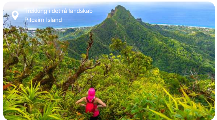
Trekking i det rå landskab Pitcairn Island

Kun godt 50 mennesker bor her, og alligevel rummer øen fortællinger, der spænder over århundreder og oceaner. Pitcairn er mest kendt som tilflugtsstedet for mytteristerne fra Bounty, og du kan stadig møde efterkommere af Fletcher Christian og hans mænd blandt de få beboere, der lever et enkelt og gæstfrit liv i tæt kontakt med naturen. Landskabet er dramatisk og frodigt – stejle klipper, dybe kløfter og tropisk vegetation, der falder ned mod det glitrende Stillehav. Langs stierne vokser brødfrugtræer og bananpalmer, og farverige fugle kvadrer fra trækrønerne. Du kan udforske ruinerne af oldgamle polynesiske bosættelser, besøge det lille museum og posthuset, hvor Pitcairns egne frimærker er eftertragtede samleobjekter, eller tage på en bådtur rundt om øen, hvor havets dybde og klippernes lodrette fald føles næsten overvældende. Det krystalklare vand indbyder til snorkling blandt koraller og fisk i regnbuens farver, og solnedgangen ses bedst fra Edge Hill, hvor du kan lade blikket glide mod horisonten og fornemme verdens fjerne kant.