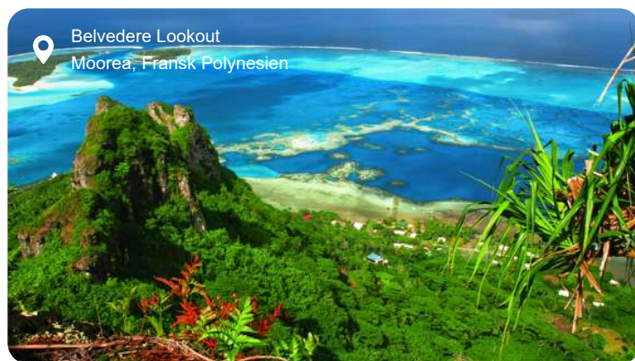
Belvedere Lookout Moorea, Fransk Polynesien

Moorea rejser sig dramatisk af havet med takkede bjergtoppe, grønne dale og en lagune, der glimter i turkis og azurblå. Øen ligger kun en kort sejlads fra Tahiti, men føles som en helt anden verden - mindre hektisk, mere afslappet og med natur, der næsten virker uvirkelig i sin skønhed. Lagunen indbyder til snorkling blandt koraller, rokker og farvestrålende fisk, og flere steder kan du tage med på bådture, hvor delfiner ofte følger med. På land snor vejene sig gennem ananasplantager og små landsbyer, hvor du møder hverdagslivet i Fransk Polynesien, der byder på duften af frisk frugt, blomsterkranse og den rolige rytme fra ukuleler. Mooreas indre gemmer på dybe dale som Opunohu og Cook's Bay, hvor bjergsiderne spejler sig i vandet og giver nogle af de mest ikoniske udsigter i hele Stillehavet. Tag op til Belvedere Lookout, hvor panoramaet folder sig ud med bjerge, bugter og lagune på én gang. Moorea kombinerer alt det, der gør Fransk Polynesien legendarisk: krystalklart vand, frodig natur og en gæstfrihed, der gør, at øen føles både som et tropisk eventyr og et sted, man hurtigt føler sig hjemme.